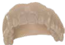
V-Print Try-In Einprobekörper für die Prothetik