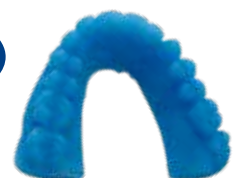
V-Print model fast Schnelldruckbare Modelle, speziell für die dentale Tiefziehtechnik