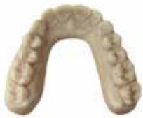
V-Print model Gesamtes Modellspektrum der Zahntechnik