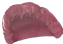
V-Print dentbase Prothesenbasen für die abnehmbare Prothetik