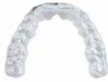
V-Print splint Therapeutische Schienen, Hilfs- und Funktionsteile die Diagnose betreffend, Bleaching-Schienen (Home-Bleaching)