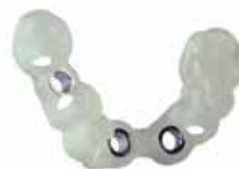
V-Print SG Dentale Bohrschablonen